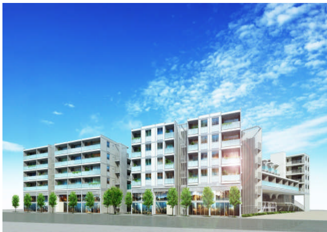
石巻テラス (災害対応型商業一体開発分譲マンション)